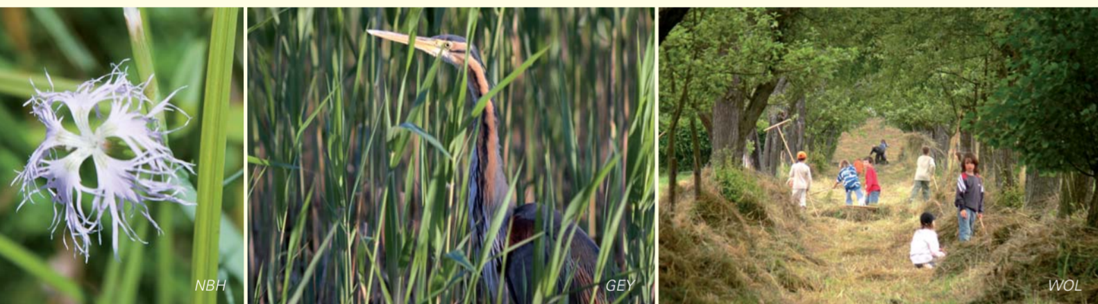
Die Prachtnelke wächst in wenig oder gar nicht gedüngten, wechselfeuchten Wiesen. L'oeillet superbe recherche des prairies à conditions hydriques alternées, peu ou pas fertilisées.

In den Wiesen zwischen Alb und Knielinger See (14) wachsen wegen des feuchten und nährstoffreichen Bodens ganz andere Pflanzen als in den Magerassen am Rheinhochwasserdamm. Es lohnt sich mehrmals im Sommer vorbeizuschauen, um das wechselnde Blütenkleid zu bestaunen: Im Frühsommer blühen zum Beispiel Kuckucks-Lichtnelke und Scharfer Hahnenfuß, im Hochsommer Arznei-Baldrian, Pracht-Nelke und Wiesen-Platterbse und im Spätsommer Großer Wiesenknopf, Blut- und Gilb-Weiderich. In nassen Mulden entwickeln sich auch kleine Riede aus Filz-, Schlank- und Sumpf-Segge mit fleischfarblichem Knabenkraut, Sumpf-Greiskraut und Sumpf-Haarstrang. Da viele Schmetterlinge nur an eine oder wenige Pflanzenarten als Nektarquelle gebunden sind, wundert es nicht, dass hier andere Arten fliegen als am Hochwasserdamm. Bemerkenswert sind zum Beispiel der Große Feuerfalter, der bevorzugt Blut-Weiderich anfliegt, und der Dunkle Wiesenknopf-Ameisen-Bläuling, der am Großen Wiesenknopf saugt.