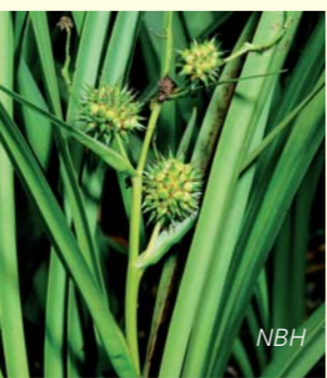
Die Früchte des Aufrechten Igelkolbens sind zu igeligen Köpfchen vereinigt. Les fruits du rubanier dressé sont regroupés en têtes hérissées.