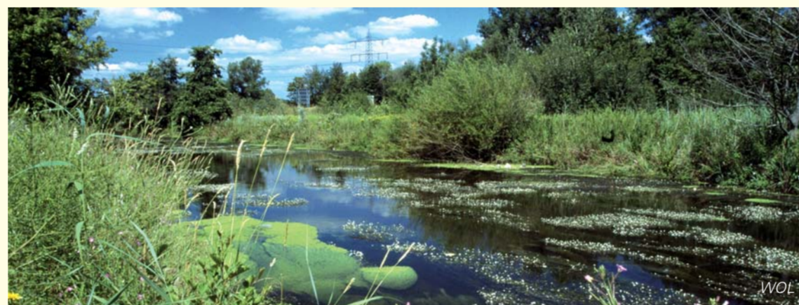
Der Flutende Hahnenfuß wurzelt im Bachgrund, kann bis zu 6 m lange Sprosse bilden und streckt im Hochsommer seine weißen Blüten aus dem Wasser. La renoncule flottante prend ses racines dans le lit des ruisseaux et ses tiges peuvent atteindre jusqu'à 6 m de longueur. En été, ses fleurs blanches parsement la surface des eaux.