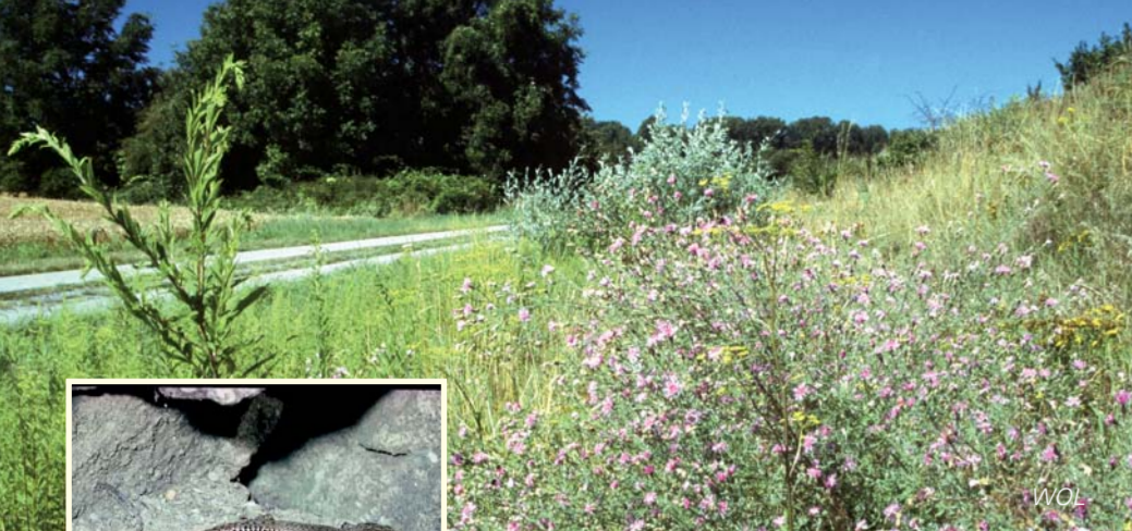
Die Rispens-Flockenblume blüht im Juli an der Böschung des Bahndammes. La centauree jacée fleurit au mois de juillet sur les digues de la voie ferrée.