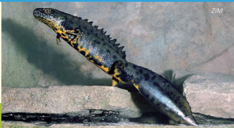
Kammolch: Den hohen und stark gezackten Hautkamm auf Rücken und Schwanz bilden nur die Männchen während der Paarungszeit. Le triton crêté: la crête dorsale et la queue fortement dentées sont caractéristiques des mâles en période de reproduction.

Auch mehrere Tümpel sind über die Burgau verstreut ⑦. Einige gehen auf Bombentrichter aus dem Zweiten Weltkrieg zurück, andere stammen von Materialentnahmen für die Fachwerkhäuser und Hochwasserdämme der Umgebung. Die Tümpel liegen im Wald oder hinter Weiden-Gebüsch und Schilf-Rohr versteckt. Sie sind Lebensraum zahlreicher Kröten, Frösche und Molche – sogar der seltene Kammolch wurde hier schon beobachtet.