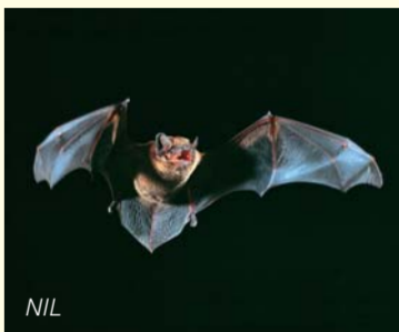
Der Große Abendsegler lebt im Sommer in Auenwäldern mit Hühlenbäumen und Jagdgewässern. L'été, la noctule est inféodée aux forêts alluviales où elle gîte dans les arbres creux et chasse au-dessus des zones aquatiques.

Standorte angepasste Baumarten: Buche, Wald-Kiefer, Birke, Berg-Ahorn, Winter-Linde. Vielerorts wurden sie auch angepflanzt. Im Gewinn Ackerheck ist noch ein ehemaliger Mittelwald erhalten ⑪. Früher ließ man hier Einzelbäume zu Bau- und Möbelholz heranwachsen. Die restlichen Bäume wurden alle 10 bis 30 Jahre für Brennholz auf den Stock gesetzt und trieben mehrschäftig wieder aus. So entstand dieser strukturreiche Waldtyp. Einige alte Eichen und Hainbuchen haben bis heute überdauert: Manche sind schon so morsch, dass Mittel- und Buntspechte ihre Bruthöhlen darin zimmern können.