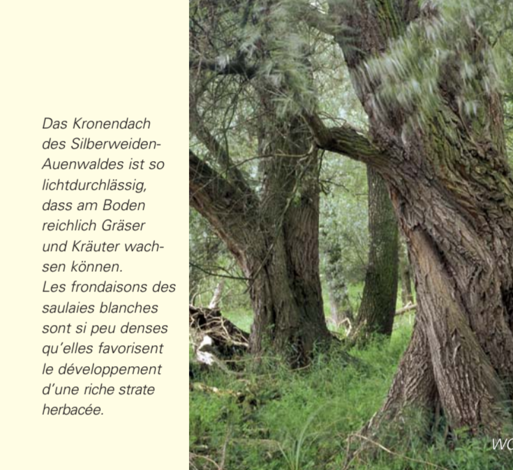
Das Kronendach des Silberweiden-Auenwaldes ist so lichtdurchlässig, dass am Boden reichlich Gräser und Kräuter wachsen können. Les frondaisons des saulaies blanches sont si peu denses qu'elles favorisent le développement d'une riche strate herbacée.