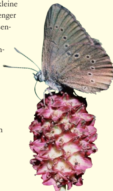
Der Dunkle Wiesenknopf-Ameisen-Bläuling legt seine Eier am Großen Wiesenknopf ab. L'azuré de la sanguisorbe dépose ses pontes sur les sanguisorbes.

300 m weiter westlich beginnt ein neuerer Abschnitt, der beim Bau der Stadtbahngeleise entstanden ist. Hier wachsen kleine Sandpflanzen und hohe Stauden in enger Nachbarschaft, zum Beispiel Zypressen-Wolfsmilch, Silber-Fingerkraut und Sand-Wegerich sowie Rispens-Flockenblume, Nachtkerze und Pastinak. Im Frühjahr sonnen sich Zaun- und Mauereidechsen an spärlich bewachsenen Stellen, im Hochsommer lauern Gottesanbeterinnen auf den Hochstauden nach Beute und im Spätsommer stimmen Weinhähnchen vor allem während der Dämmerung ihren melancholischen Gesang an.