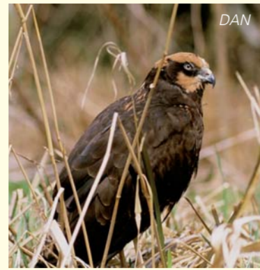
Die Rohrweihe ruht, nistet und übernachtet in großen Schilfröhrichten. Le busard des roseaux est inféodé aux grandes roselières.