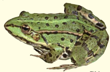
Liebt krautreiche Gewässer und sonnt sich gerne am Ufer: der Wasserfrosch. Privilégiant les eaux riches en végétation et aimant les baignades sur les berges, la grenouille verte.

Das größte Gewässer im Gebiet, der Knielinger See ④, entstand in den Jahren 1959 bis 1990 durch Kies-Ausbaggerung. Er ist ein bedeutender Rast- und Überwinterungsplatz für Wasservögel. An manchen Wintertagen ruhen hier bis zu 500 Taucher und Enten: Gänsesäger, Zwergsäger, Haubentaucher, Krickente, Löffelente, Reiherente, Schellente, Stockente, Tafelente – welch ein Geschnatter!